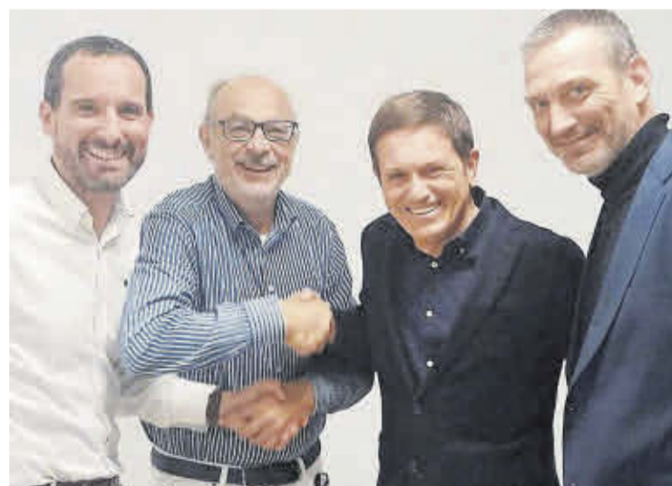
Representants del polígon, Grup Rubau i Solventa6

L'entesa, que s'ha signat aquest mes de febrer, és el resultat d'un concurs promogut per l'APRS on han participat diverses corporacions especialitzades en el sector de les renovables. L'acord signat té