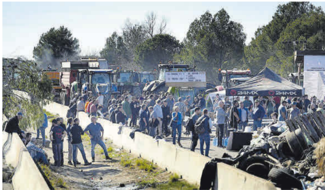
Pagesos ahir a l'AP-7.

► Aixequen el tall a l'AP-7 i l'N-II després de més de 30 hores, però adverteixen que tornaran al carrer si no es compleixen els compromisos