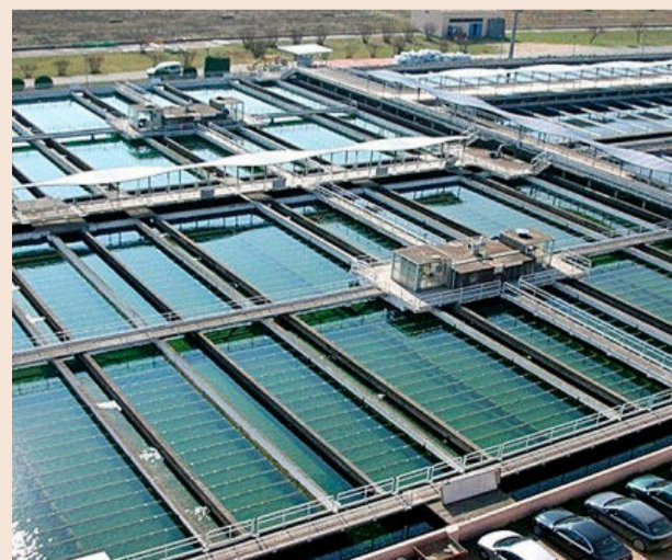
La estación de tratamiento de agua potable del Ter.

ceras partes de Barcelona y su conurbación. La estación se inauguró en 1966 y ayer la consellera de Territori, Sílvia Paneque, colocó la primera piedra de la ampliación. La planta está situada entre los municipios de La Roca, Llinars y Cardedeu (Vallès Oriental) y recibe agua del río Ter. Las obras cuentan con financiación del Banco Europeo de Inversiones (BEI).