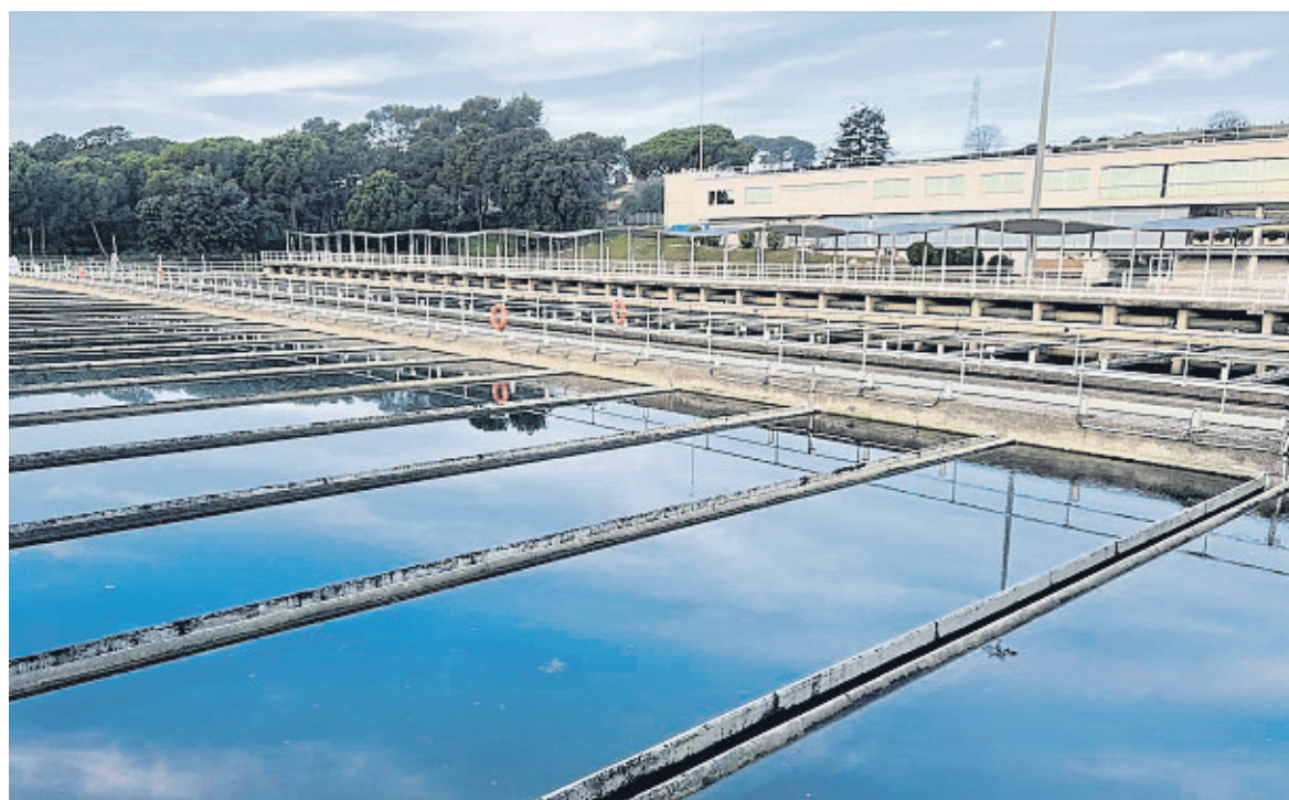
ALBERT SEGURA / ACN

"Amb aquestes obres donem resposta a la rehabilitació i la modernització de la potabilitzadora, perquè al llarg d'aquests anys han sorgit noves tecnologies pel tractament de l'aigua i perquè també hem de preveure noves normatives so-