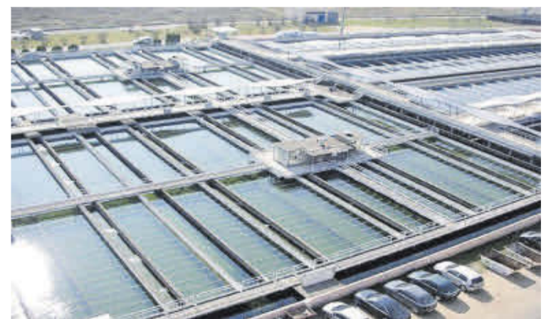
Una imatge aèria de la planta potabilitzadora del Ter.

instal·lacions per a la desinfecció de l'aigua. Així mateix, s'implementaran diverses infraestructures, com ara un dipòsit per a l'aigua filtrada, una estació de bombament intermedi, un edifici d'ozonització, i una estructura per tal d'albergar els filtres de carbó actiu.