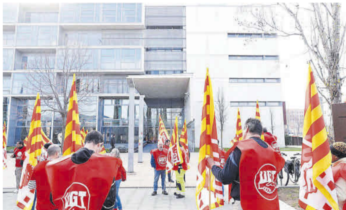
Una protesta del sindicat UGT davant el Palau de Justícia de Girona.

La quantia mitjana que van rebre els treballadors afectats amb sentència favorable va ser de 671.495 euros, amb una mitjana de